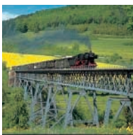
DIE ROMANTISCHE MUSEUMSBAHN