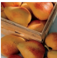
NUR BESTE FRÜCHTE VON OBSTBAUERN AUS DEM SCHWARZWALD FINDEN DEN WEG IN DIE WEKERLE'SCHE BRENNEREI

Dabei gilt, wie so oft: Probieren geht über studieren!