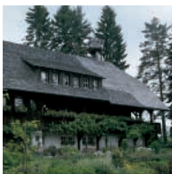
DER MALERISCHE HOCHSCHWARZWALD