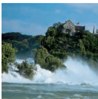
DER BEEINDRUCKENDE RHEINFALL