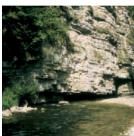
DIE IDYLLISCHE WUTACHSCHLUCHT

den größten Wasserfall Europas: Tausend stürzen die Wasser des jungen Rheins in die Tiefe.